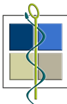
Conférence des Doyens

Conférence des Doyens • SANTÉ des facultés de Médecine • FORMATION RECHERCHE